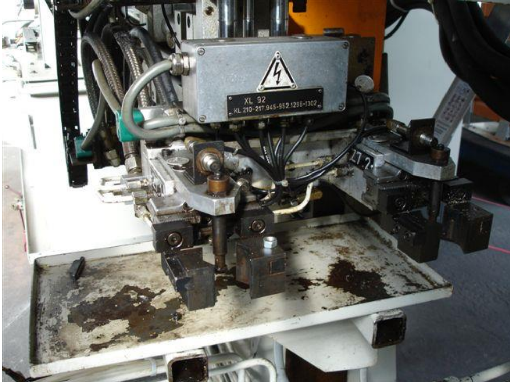
Ladesystem (Greifer) für Werkstückzubringer linksseitig an der Maschine angebracht