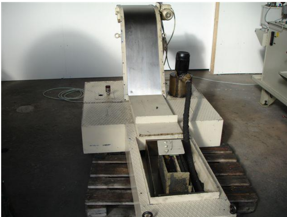
externe Kühlmiteleinrichtung mit Magnetband- Spänefördereinrichtung