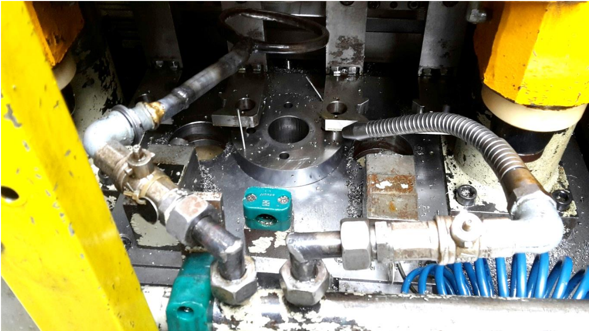
Werkstücktisch mit Werkstückgreifer für 2 Werkstücke Ansicht von der Maschinen Innenseite (vorderseitig)