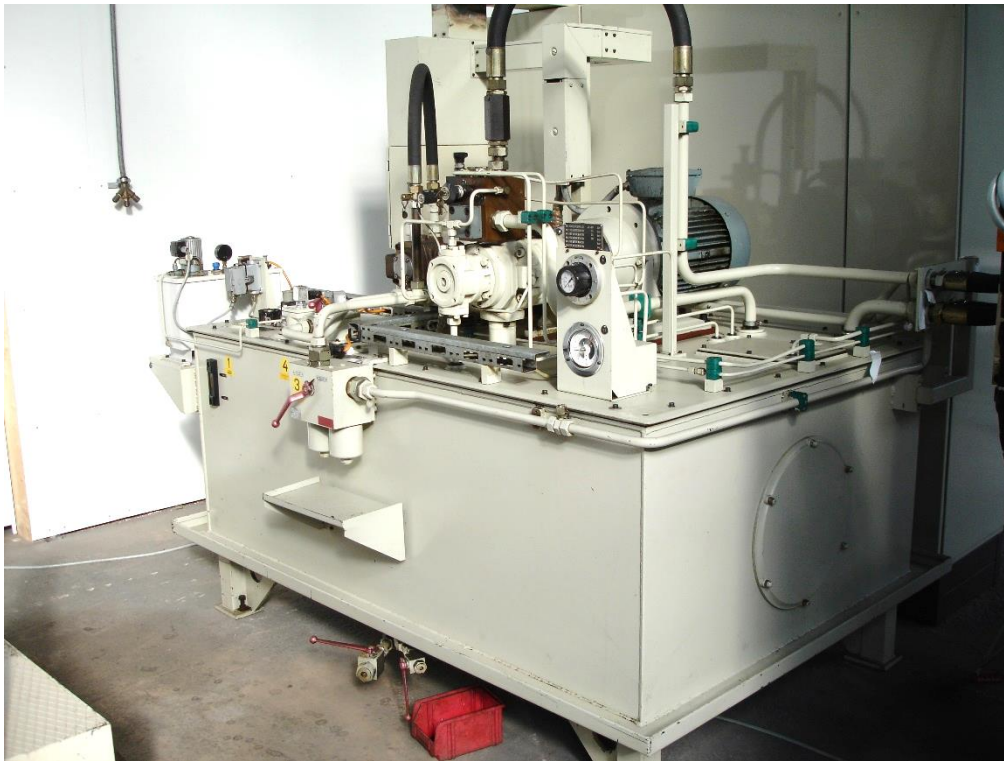
großvolumige externe Hydraulikanlage speziell für die Großserienproduktion