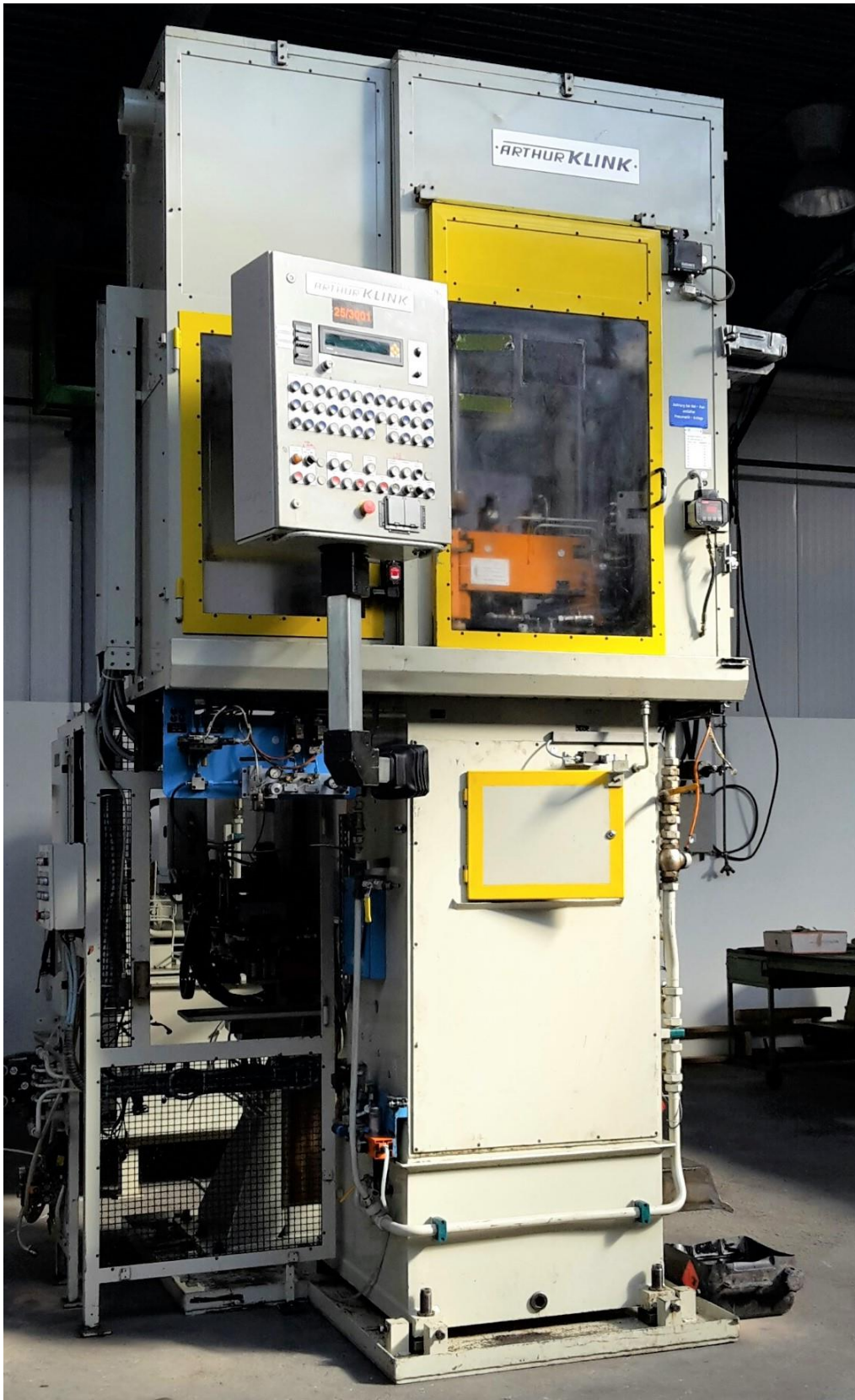
frontseitige Maschinengesamtansicht mit linksseitig angeflanschten Werkstückzubringersystem & Bedienpanel