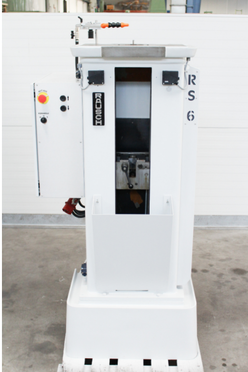
Vorderansicht der Maschine mit Bedienpanel & Spänefang