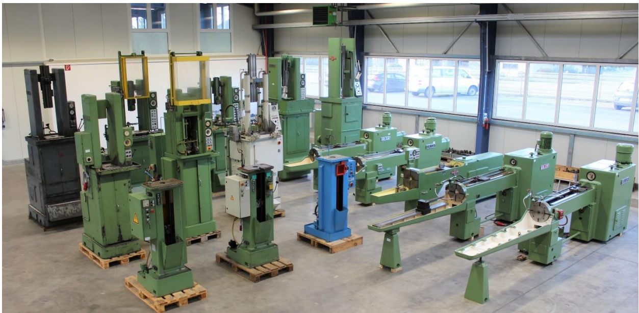
Bild aus unserem Gebrauchtmaschinen Lager, mit horizontalen und vertikalen Maschinen bis 16.000 kg Zugkraft

Wir sind vom Hause ein Lohnräumbetrieb und können Ihnen auch bei technischen Fragen aus 50-jähriger Erfahrung in der Räumtechnik behilflich sein.