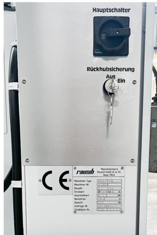
Detailansicht Maschinenrückseite mit Hauptschalter und Typenschild