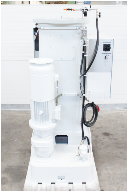
Ansicht Maschinenrückseite mit Hauptantrieb