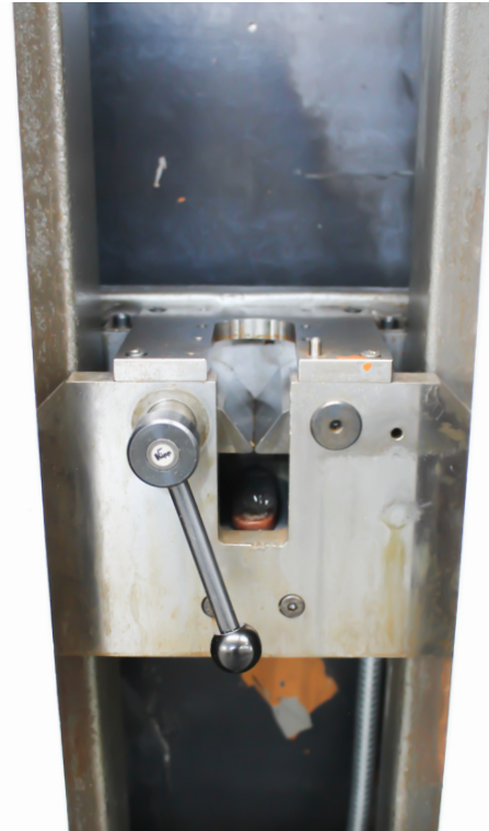
Detailansicht der Zugbrücke