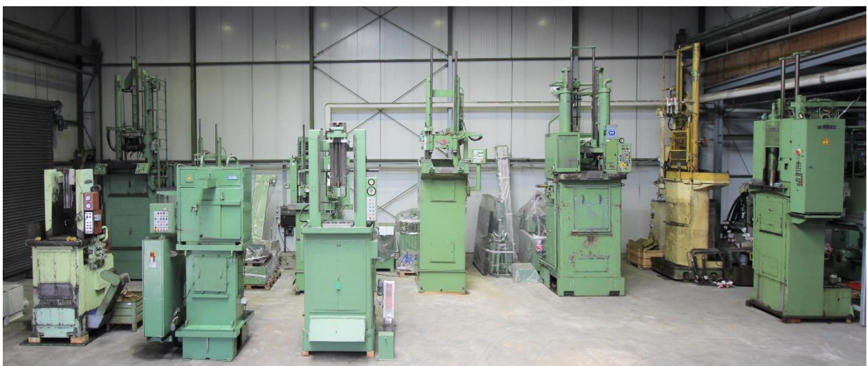
Bild aus unserem Gebrauchtmaschinen Lager, mit vertikalen Maschinen bis 63.000 kg Zugkraft