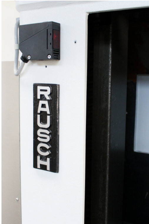
Maschinenvorderseite mit Sicherheitsabfrage