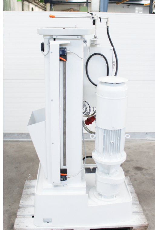
Ansicht Maschinenseite rechts mit außenliegender Verstellung des Räumhubes