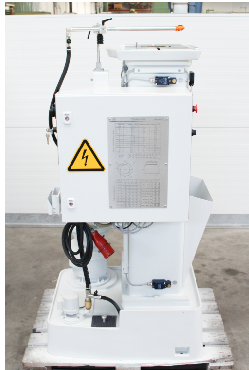
Ansicht Maschinenseite links mit Schaltschrank & Kühlmitteleinrichtung