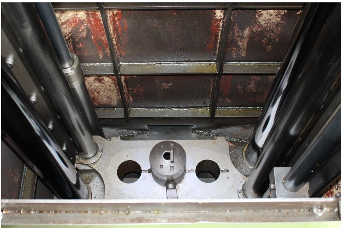
Werkzeugbrücke für 3 Ziehköpfe mit hydraulischer Verriegelung (DIN 1417)