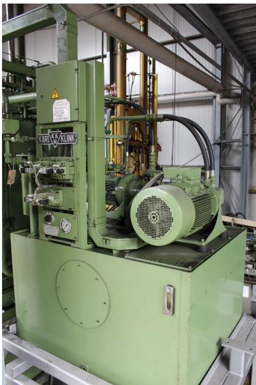
Hydraulik ( zur Zeit auf einem Podest montiert)