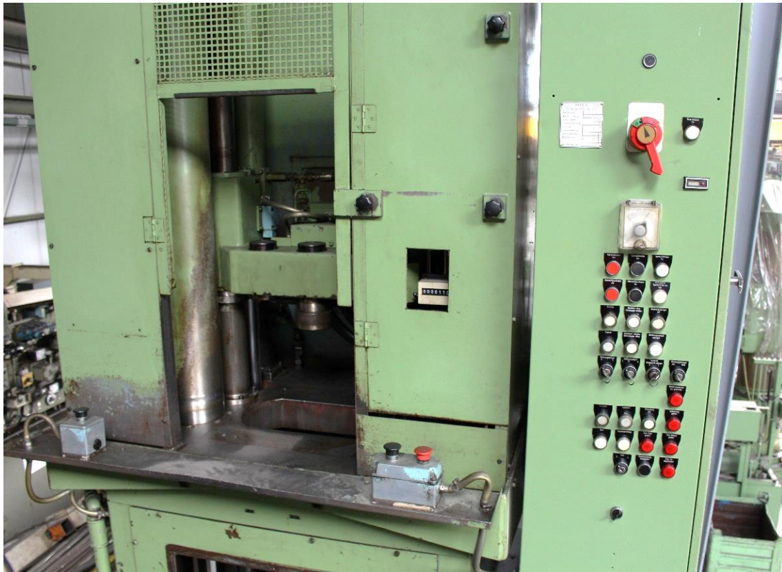
Maschinenbedienerseite mit Bedienfeld und 2-Hand Auslösung