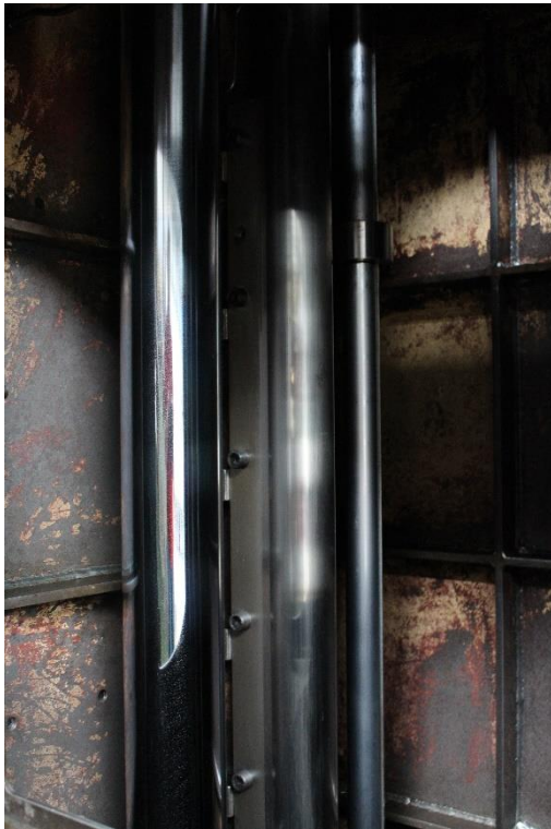
Innenansicht Zylinder und Führung