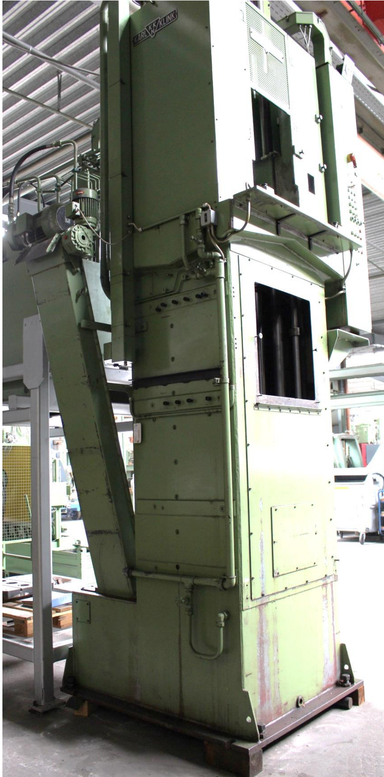
Maschinenseitenansicht vorne links mit Magnetbandspäneförderer