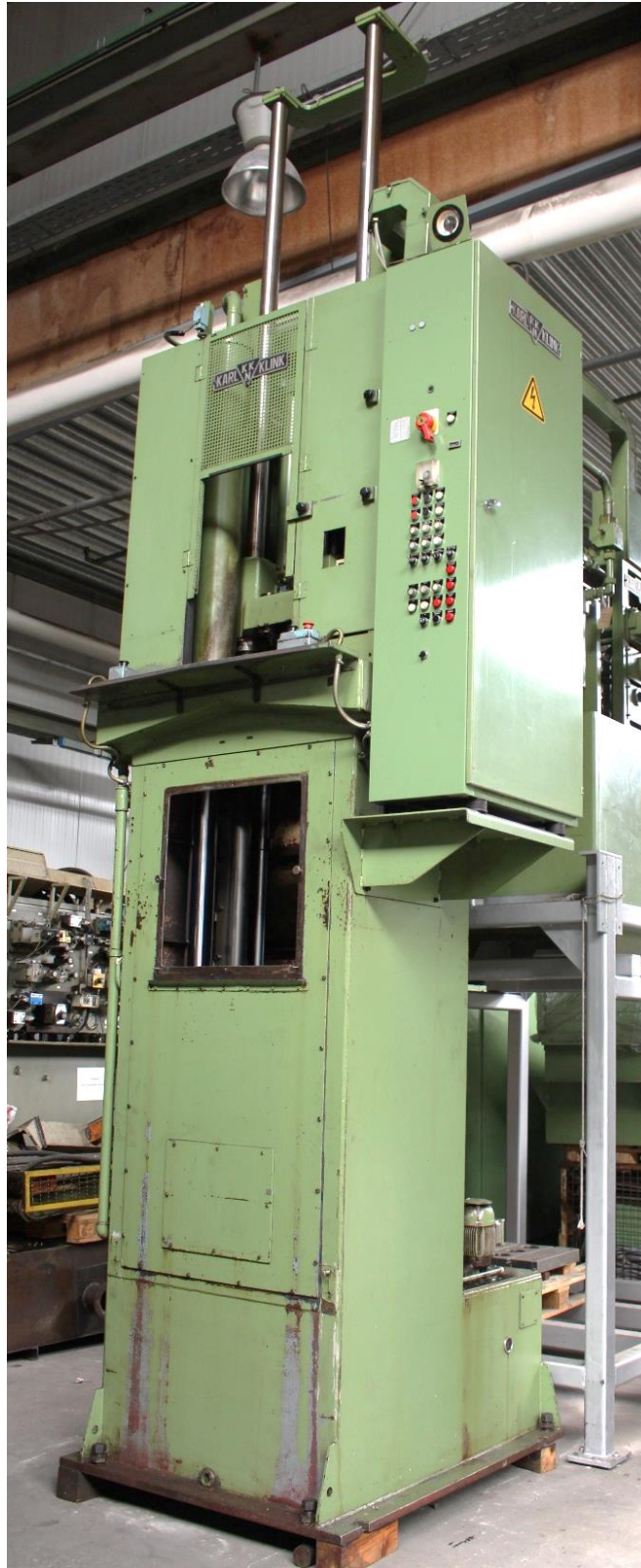
Maschinengesamtansicht vorne rechts