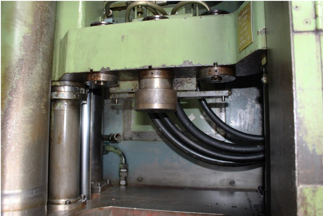
Werkzeugzubringer mit hydraulischer Verriegelung für 3 Räumwerkzeuge