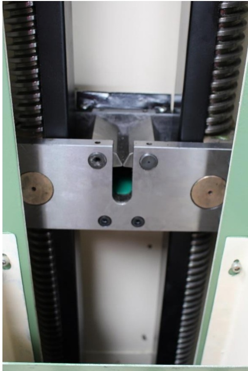
Maschinen- Innenansicht mit universal Spannbacken- Ziehkopf für Flachsäfte