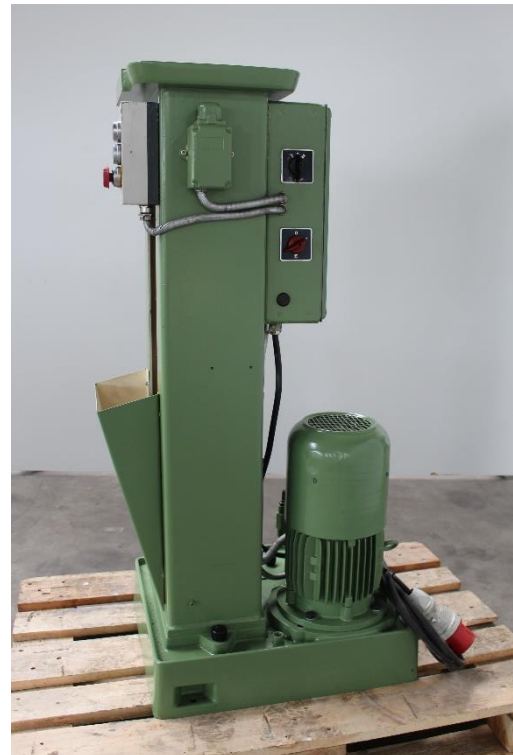
Ansicht Maschinenseite rechts mit mechanischem Hauptantrieb