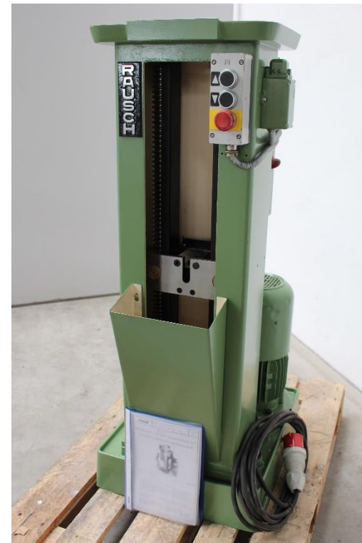
Maschinengesamtansicht mit Dokumentation