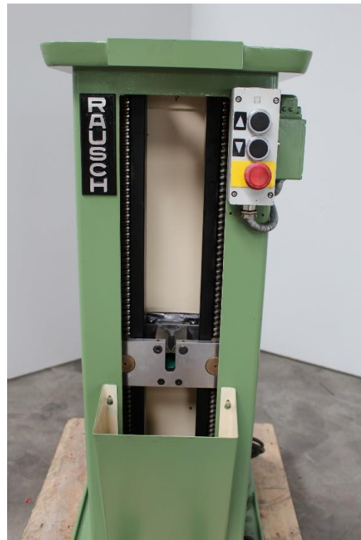
Maschinen- Innenansicht mit Bedienpanel für Räumhub