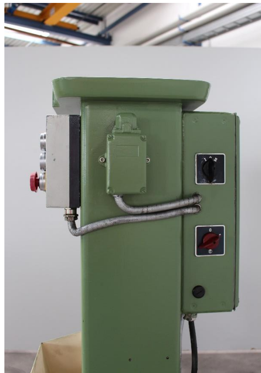
Schaltelement für Räumhub Verstellung