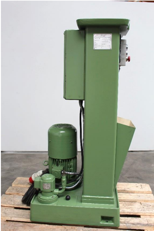
Ansicht Maschinenseite links mit integrierter Kühlmittleinrichtung