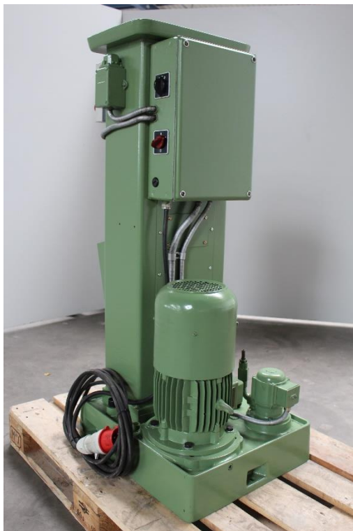
Maschinen Rückseite mit Hauptantrieb