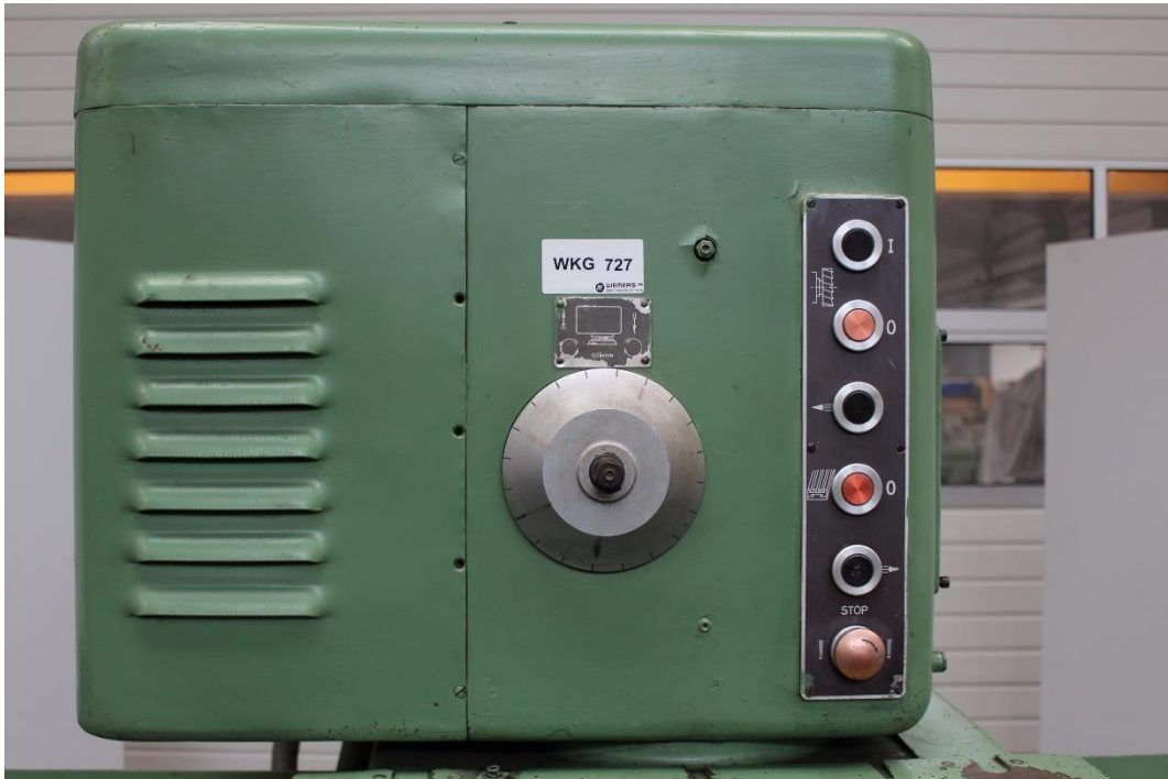
Bedienfeld mit Z -Zustellung und Maschinenbedienpanel