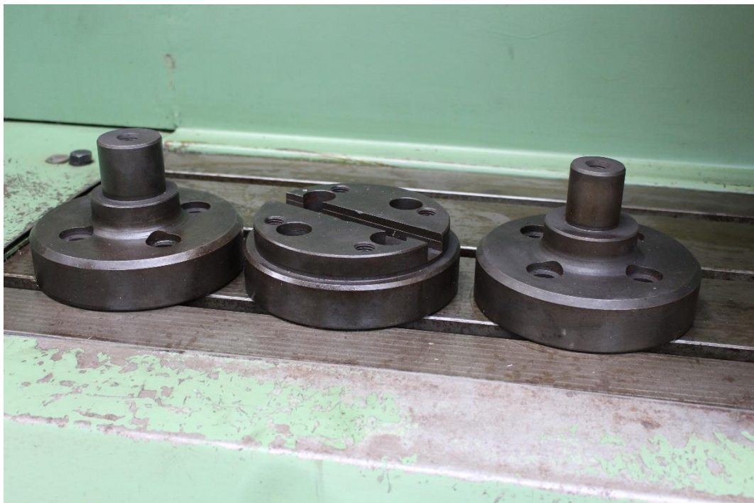
3 Stück zusätzliche Werkzeugaufnahmen