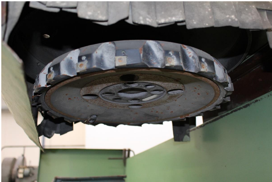
Messerkopf \varnothing 400mm