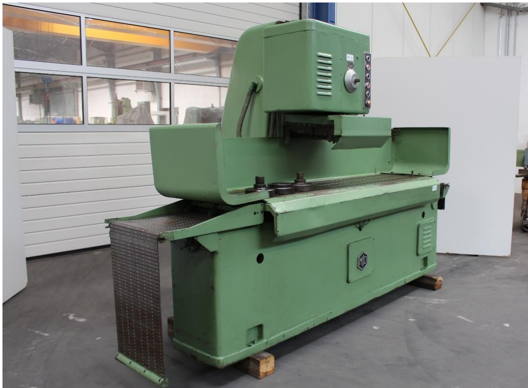
Maschinenansicht vorne linkseitig