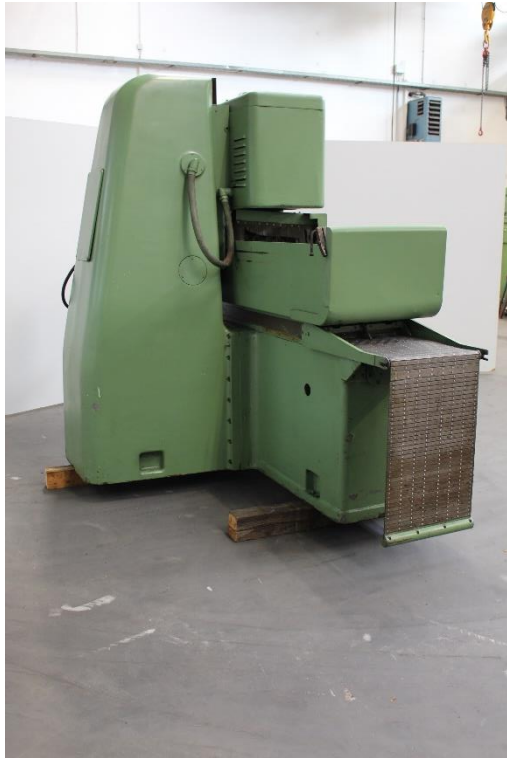
Maschinenansicht hinten links