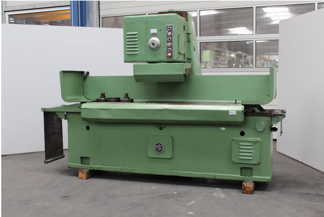
Maschinenansicht Bedienerseite (Vorderseitenansicht)