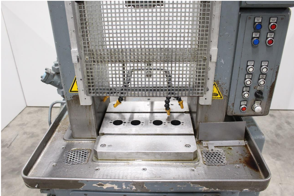
Werkstücktisch mit Bedienpanel, Maschinentisch für 4 Räumstellen, passende Sonderziehköpfe sind dazu lieferbar