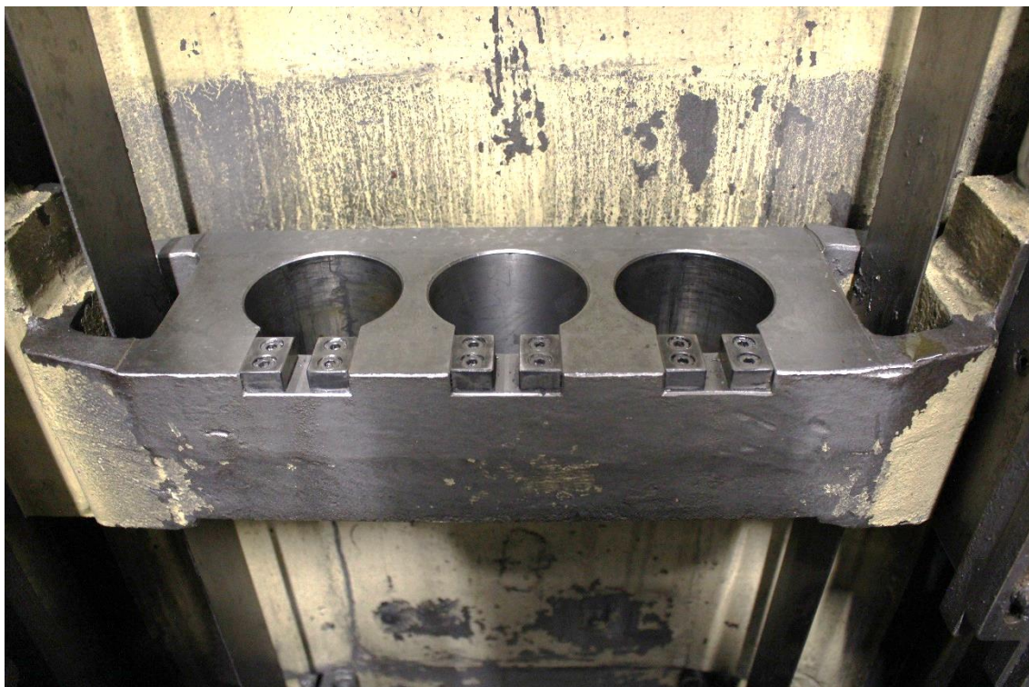
Zugbrücke für 3 Räumstellen Aufnahme Durchmesser der Ziehköpfe 3 x \varnothing 85mm