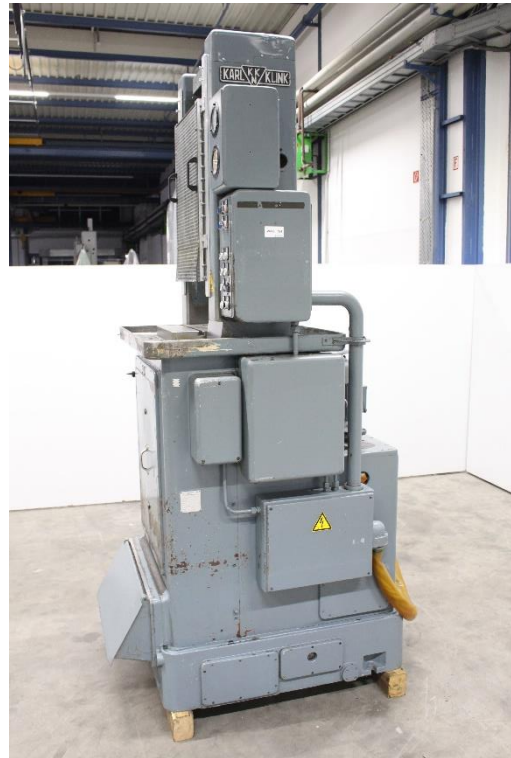
Ansicht Maschinenseite rechts