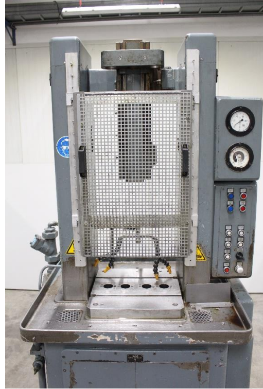
Maschinenoberseite mit Werkzeugzubringer &amp; Bedienpanel