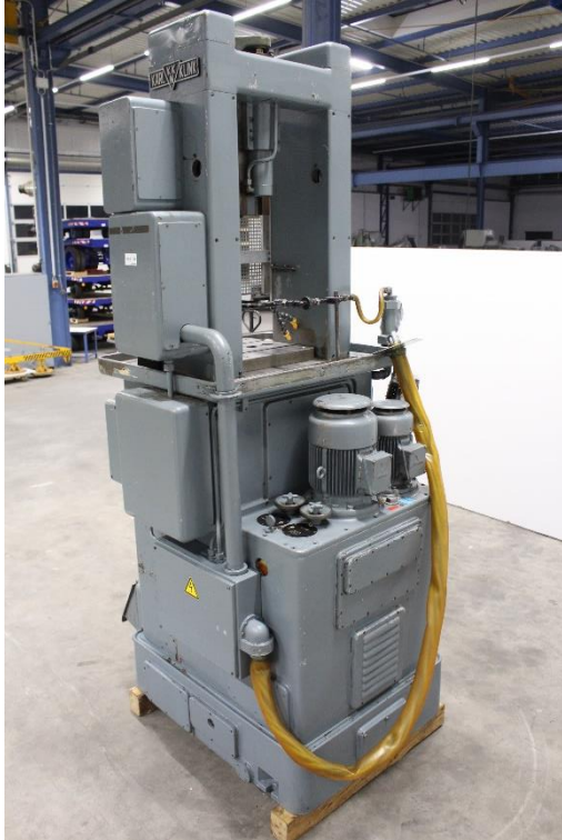
Ansicht Maschinrückseite mit steckbarem Kabelstrang s