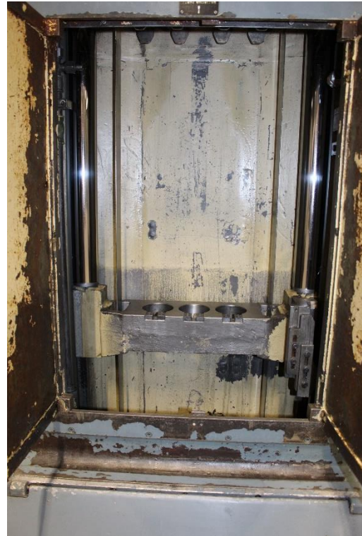
Maschineninnenansicht mit Zugbrücke für 3 Ziehköpfe