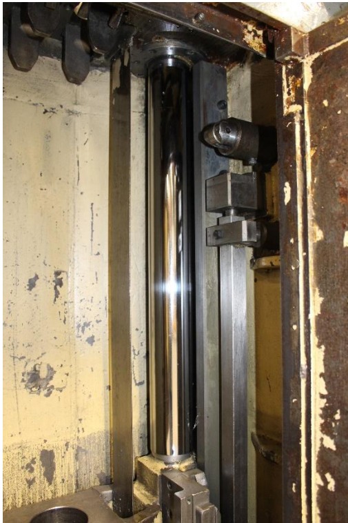
Maschineninnenansicht mit Zylinder & Schaltgestänge