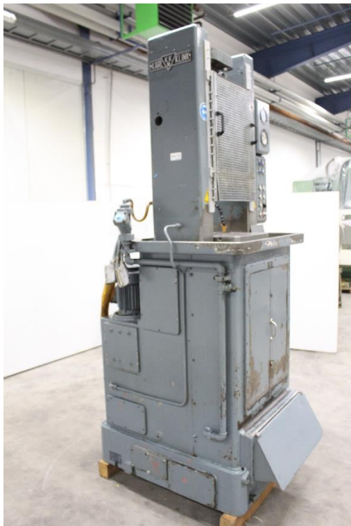
Ansicht Maschinenseite links