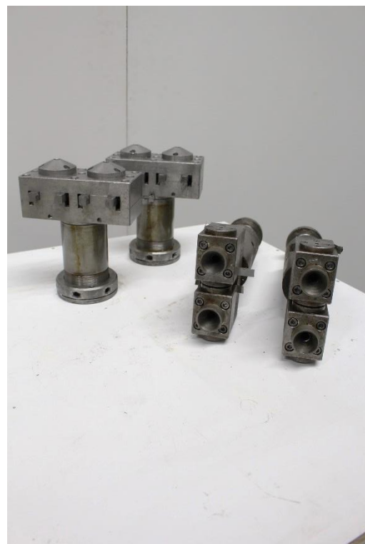
optionale Sonderziehköpfe & Nadelausheber für 4 Räumstellen