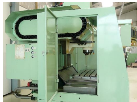
Seitenansicht links mit Werkzeugwechsler