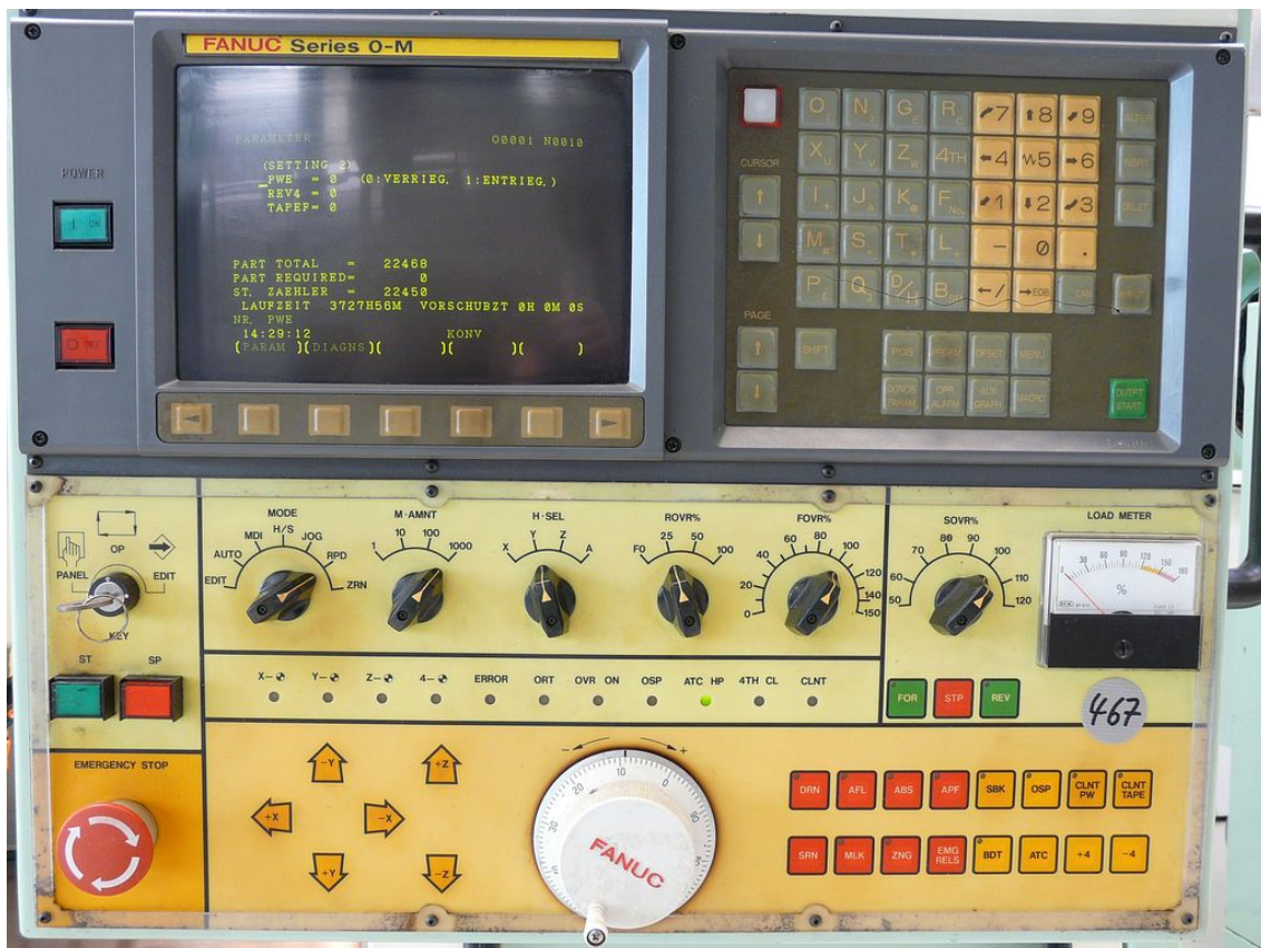
Bedienpanel Fanuc Steuerung