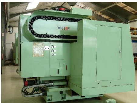
Seitenansicht links mit Werkzeugwechsler