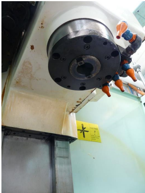
Maschinenspindel mit Kühlmittelzufuhr