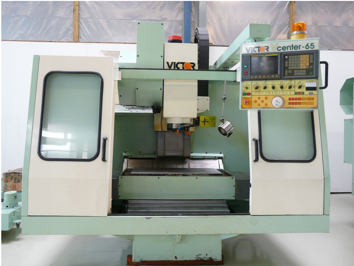
Gesamt- Maschinenansicht mit Bedienpanel Fanuc Steuerung