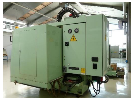
Seitenansicht rechts mit E-Schaltschrank