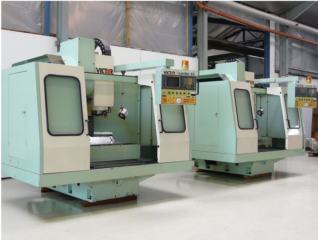
Victor Bearbeitungszentren (WKG 466) & (WKG 467)