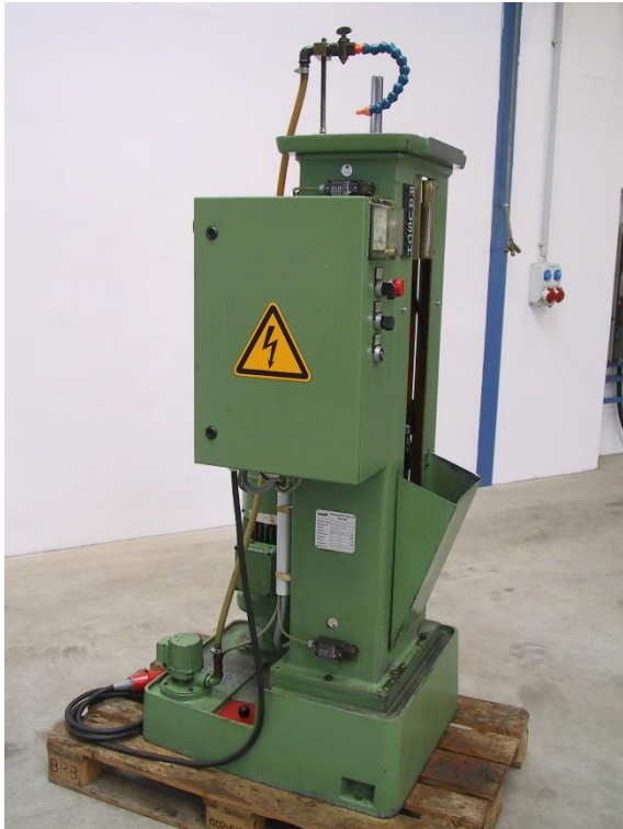
Ansicht Maschinenseite links mit Schaltschrank & integrierter Kühlmitteleinrichtung