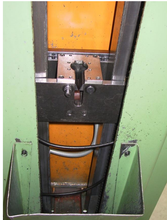
Maschinen-Innenansicht mit universal Spannbacken- Ziehkopf für Flachsäfte