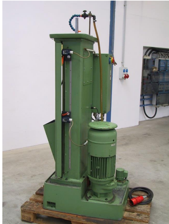
Ansicht Maschinenseite rechts mit mechanischem Hauptantrieb