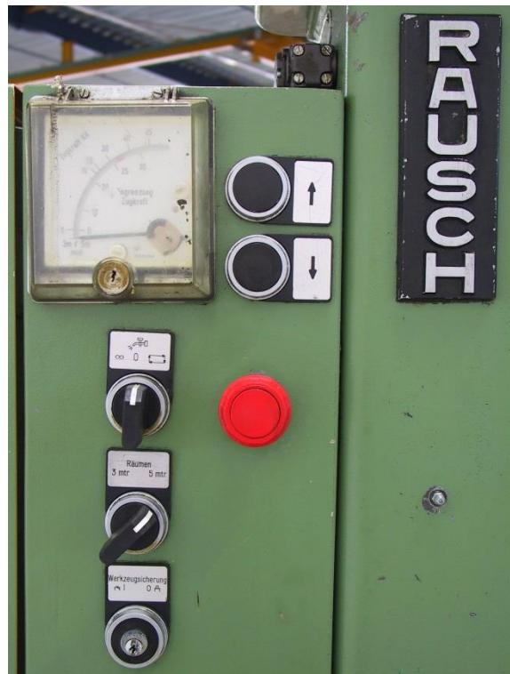
Bedienpanel mit Geschwindigkeitsverstellung & Zugkraftanzeige