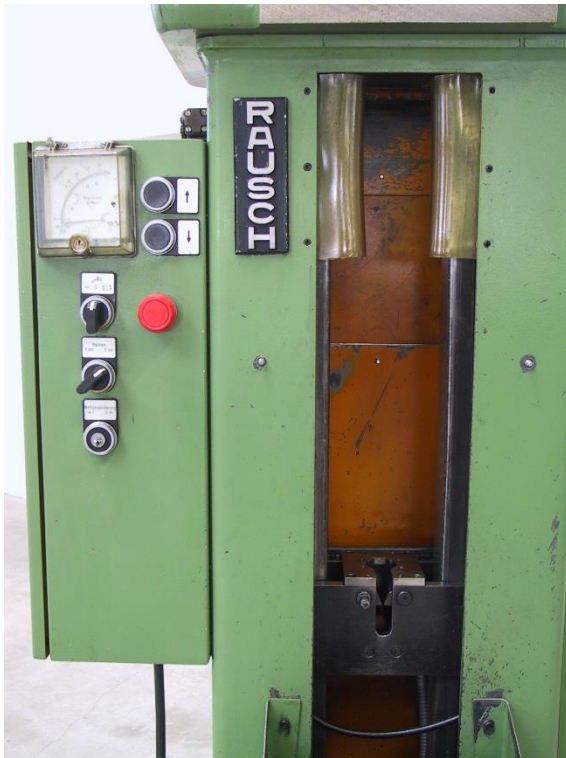
Maschinen-Innenansicht mit Zugbrücke und Bedienpanel mit Zugkraftanzeige