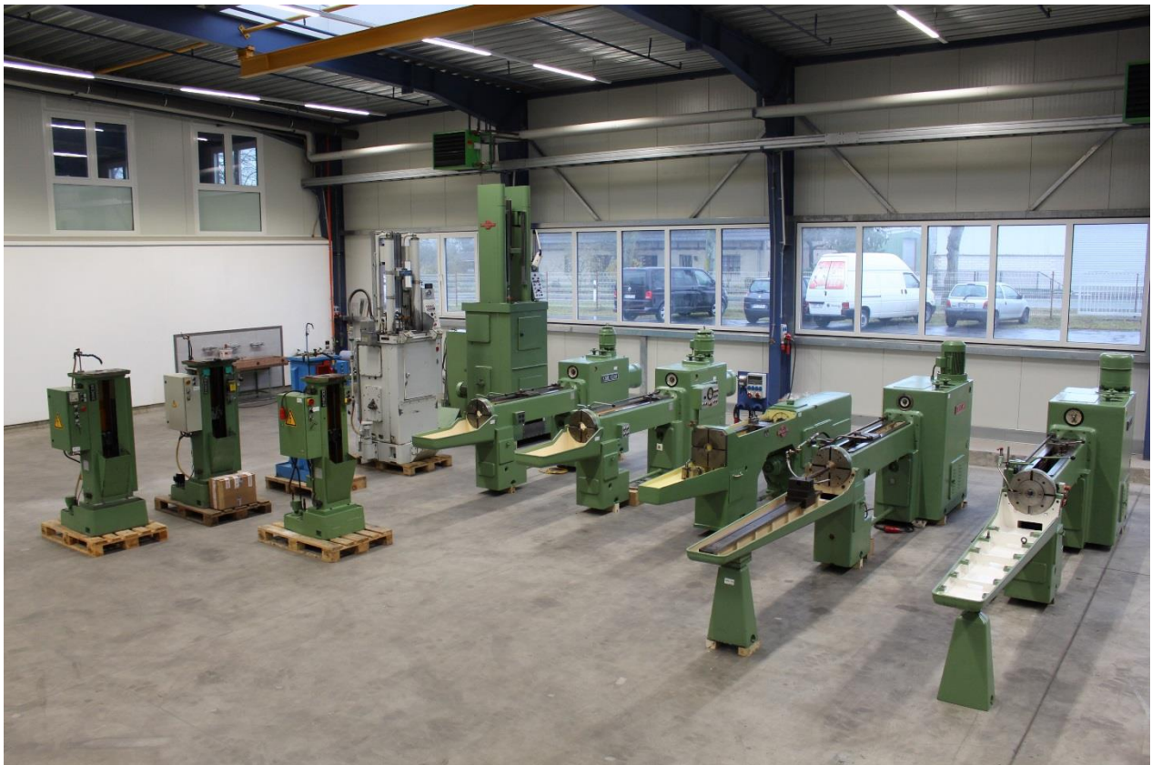
Bild aus unserem Gebrauchtmaschinen Lager, mit horizontalen und vertikalen Maschinen

Wir sind vom Hause ein Lohnräumbetrieb und können Ihnen auch bei technischen Fragen aus 50 jähriger Erfahrung in der Räumtechnik behilflich sein.