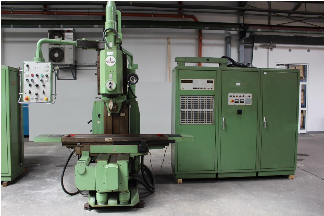
Gesamtmaschinenansicht mit Schaltschrank