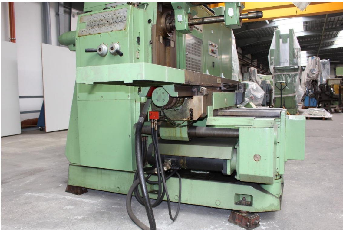
Position der Motoren für die X und Y Achse bzgl. Steuerungsumbau