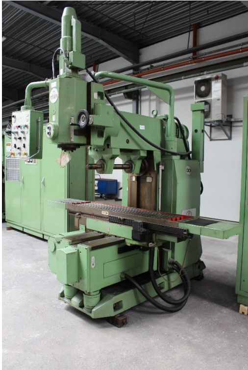
zur Maschine gehört nur 1 Gegenhalter (der 2te gehört zur Maschine WKG 345)