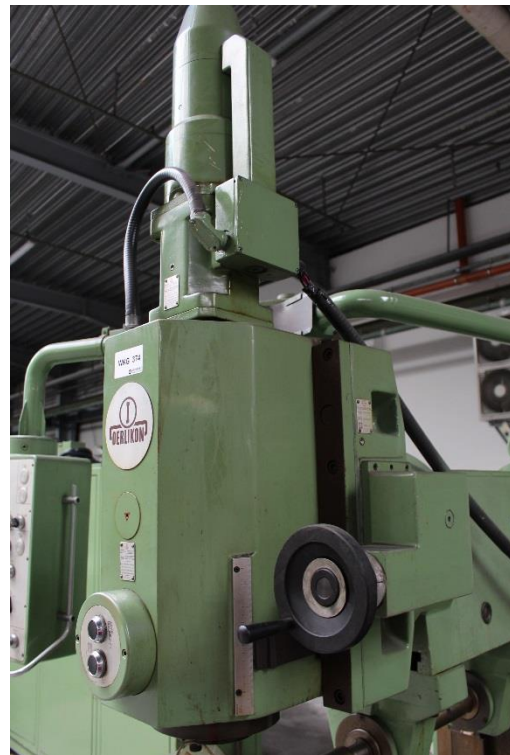
zusätzliche Vertikal-Spindelzustellung über manuelles Handrad ca. 150mm