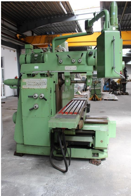
Maschinenaufbau mit einzel Getrieben für vertikal und horizontal Spindel